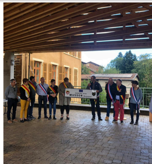
Inauguration du panneau de jumelage lors de la visite de nos amis belges en octobre dernier.

*Mussy-la-Ville étant une des 6 communes regroupée et rattachée à Musson.