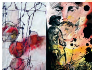
Illustrations de Marine Chalayer

Une expo nouvelle par mois, d'avril à octobre