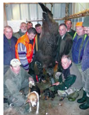
Entouré par quelques chasseurs de Lamure sur Azergues, un grand quar- tenier (appellation utilisée parfois dans la littérature pour désigner les grands mâles de sanglier) qui pesait 114 kg, capturé au Vanel en 2008 après avoir blessé gravement un chien qui tentait de le débusquer.

Ainsi va la vie de l'association de chasse en constante activité.